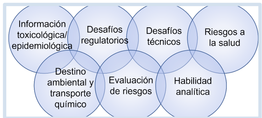
Figura 1. Desafíos en comunicación de riesgo de PFAS

Como un grupo de compuestos químicos, PFAS genera algunos desafíos de comunicación únicos para profesionales de comunicación de riesgos porque conllevan muchos de los factores de riesgo considerados como inaceptables por el público. Porque todavía hay mucho que aprender sobre PFAS, esto complica explicar y compartir información de los problemas relacionados con PFAS y sitios contaminados, dificultando establecer confianza entre partes interesadas y profesionales de comunicación de riesgo. La sección 14.2 del documento de orientación presenta una compilación de desafíos en la comunicación de riesgo de PFAS categorizados por los temas presentados en la Figura 1. Dos ejemplos de estos desafíos son: